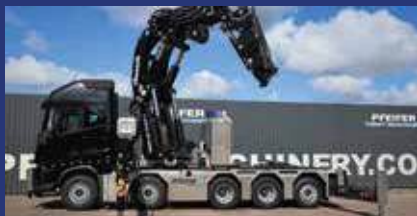
Pfeifer Rentals & Sales

Per 1 oktober heeft Pfeifer Rentals & Sales haar verhuurdiensten uitgebreid en is gestart met een nieuwe divisie: Pfeifer Lift & Move. Deze tak is overgenomen van Ter Horst Groep, inclusief het ervaren personeel, waarmee Pfeifer nu dus naast onbemande ook bemande hijskranen, verreikers en hoogwerkers kan verhuren. Door deze overname kan Pfeifer voortaan een totaalpakket bieden en daarmee haar klanten volledig ontzorgen.